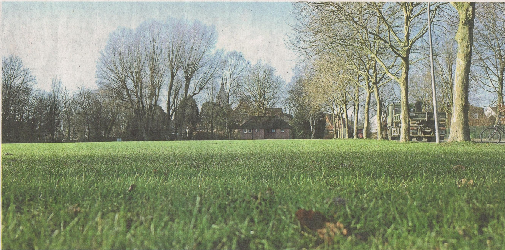
Über weite Strecken des Jahres liegt der Wessumer Dorfplatz trist und verlassen da – das soll sich nach dem Willen der Vereine ändern.